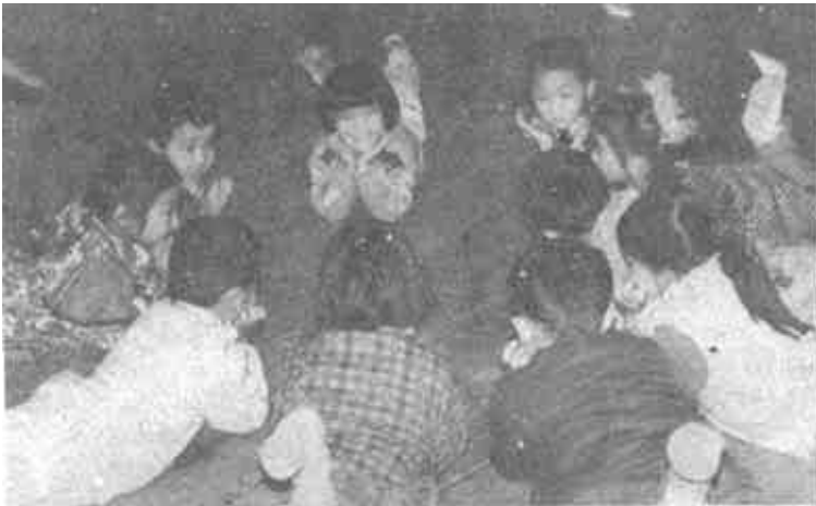
△ 市政府第二幼儿园结合幼儿特点,改进教学方法,经常组织幼儿开展形式多样、内容丰富多彩的娱乐活动,使孩子们健康成长。瞧,又是一个迷人的故事会。(本报记者 摄)

广饶讯 广饶县大营乡团委在改革开放,发展经济的新形势下,带领全乡青年加入到发展经济的大潮中。他们在税务所、工商所、农科站等有关单位的协助下,组织全乡140多名青年成立了20个活动小组,根据不同特长,分别组织他们学习专业技术、学习经营管理等知识,引导他们走致富之路,在团委的鼓舞和热心帮助下,已有40多名青年分别从事建筑安装、商业、饮食、化工、修理等,其中新河村几名青年集资开办了一家化工厂、青年团员吴效良办起了个体饭店,取得了很好的经济效益。(乐永 志强 李广)